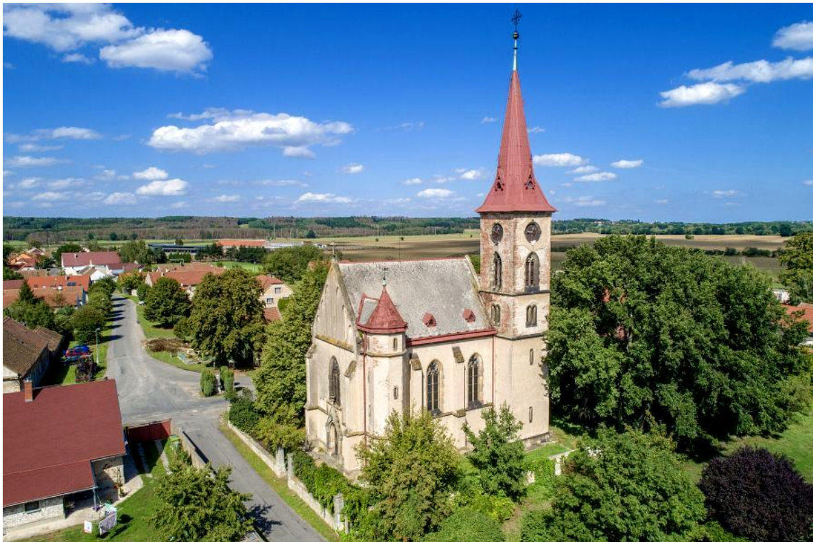
Obrázek č. 4 – Pohled na novogotický kostel Zvěstování Panny Marie