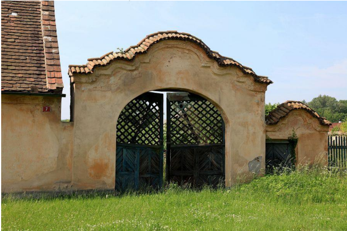
Obrázek č. 9 – Brána usedlosti č.p. 7

Další venkovská usedlost ve Veletově pochází z konce 18. století. Velmi hodnotná je zděná brána s brankou, která je datována do 1. třetiny 19. století. Usedlost čp. 7 stojí na západ od návsi.