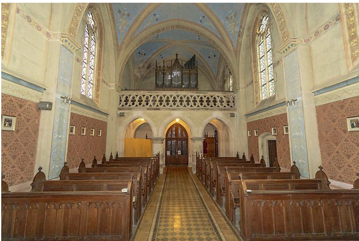
Obrázek č. 5 – Kostel Zvěstování Panny Marie, pohled ke kůru