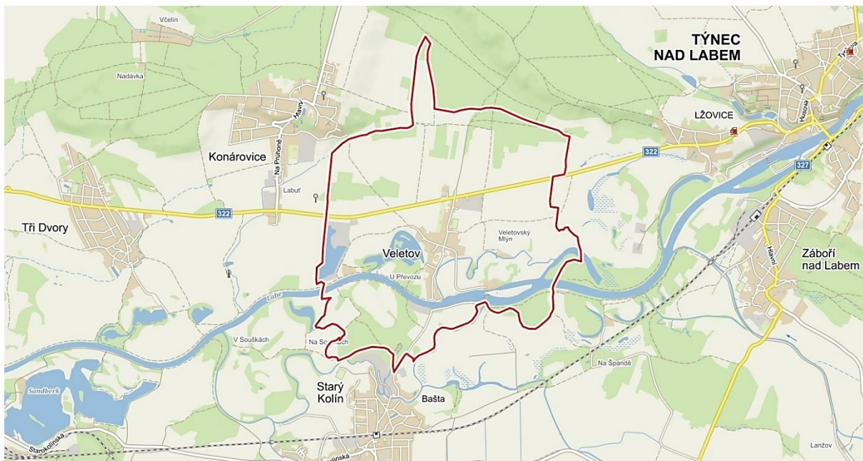
Obrázek č. 1 - Poloha a katastrální území obce Veletov, zdroj: mapy.cz