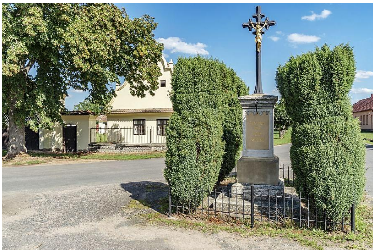
Obrázek č. 6 – litinový křížek

Křížek pochází z roku 1882. Obnovený byl nákladem obce v roce 2013. Křížek stojí v centru obce před kostelem.