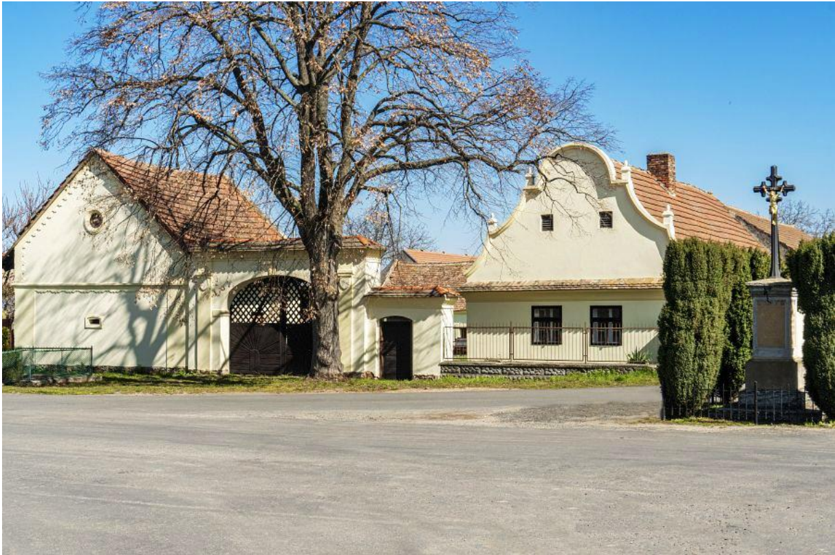
Obrázek č. 10 – Usedlost č.p. 37

Památkově velmi hodnotný areál kompletně dochované polabské usedlosti z let 1830-40. V letech 2015-16 byla provedena památková obnova usedlosti. Usedlost čp. 37 stojí na východní straně návsi u kostela.