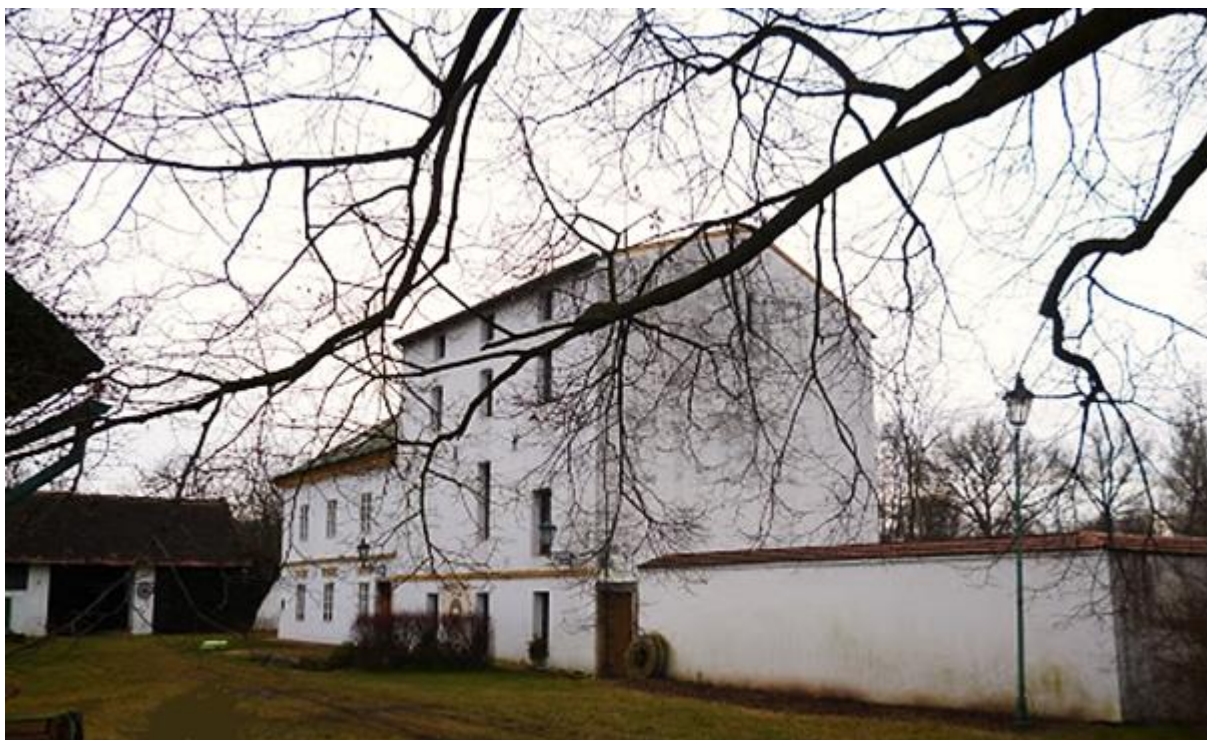
Obrázek č. 11 – Veletovský mlýn

Před vtokem na elektrárnu jsou umístěny hrubé a jemné česle a dřevěná stavidlová tabule ovládaná elektricky. Ve strojovně je instalována Francisova turbína s max. hltností 3,63 m 3 /a max. výkonem 34,58 kW. V pravé části objektu je jalový odpad hrazený rovněž dřevěnou tabulí s mechanickým ovládním. Vlevo u elektrárny je pevný boční jez staropražského typu. Veletovský mlýn se nachází východně od obce.