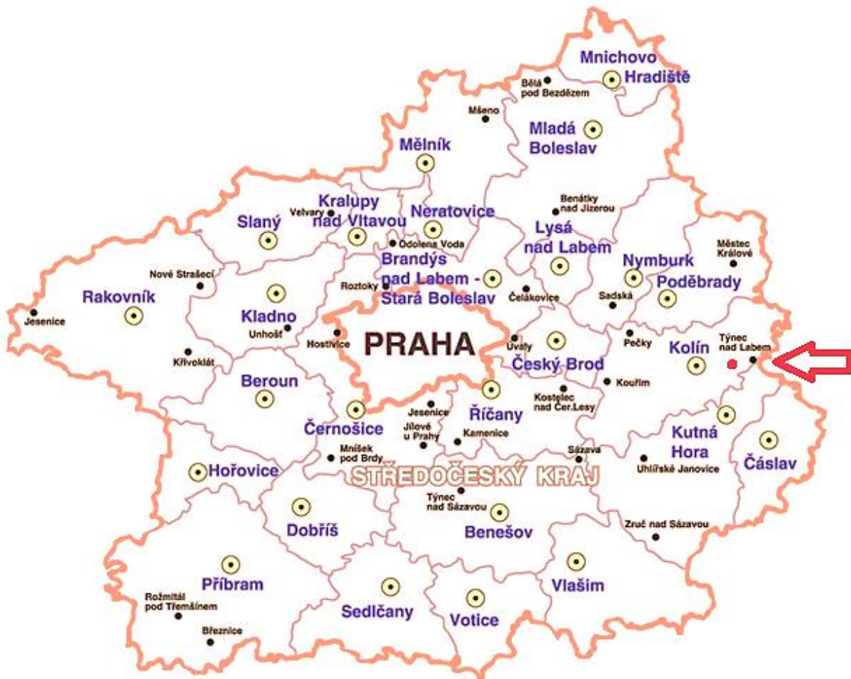
Obrázek č. 3: Správní mapa ČR; Středočeský kraj a Praha s vyznačením obce Veletov (červený bod)