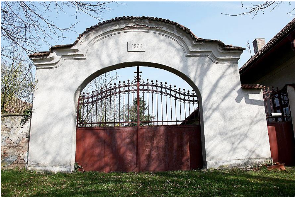
Obrázek č. 7, 8 – Venkovská usedlost č.p. 24

Brána usedlosti je zapsána do Ústředního seznamu nemovitých kulturních památek ČR pod č. 26337/2–876.