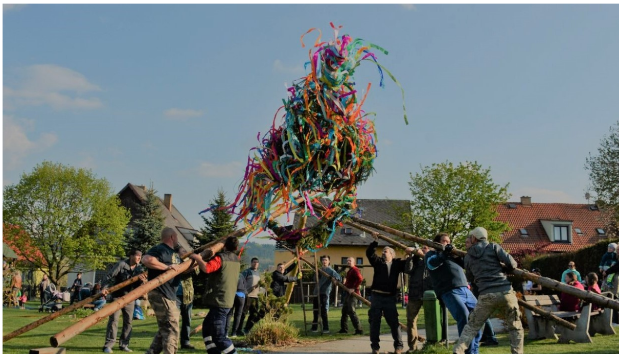
Stavění májky v obci Kájov