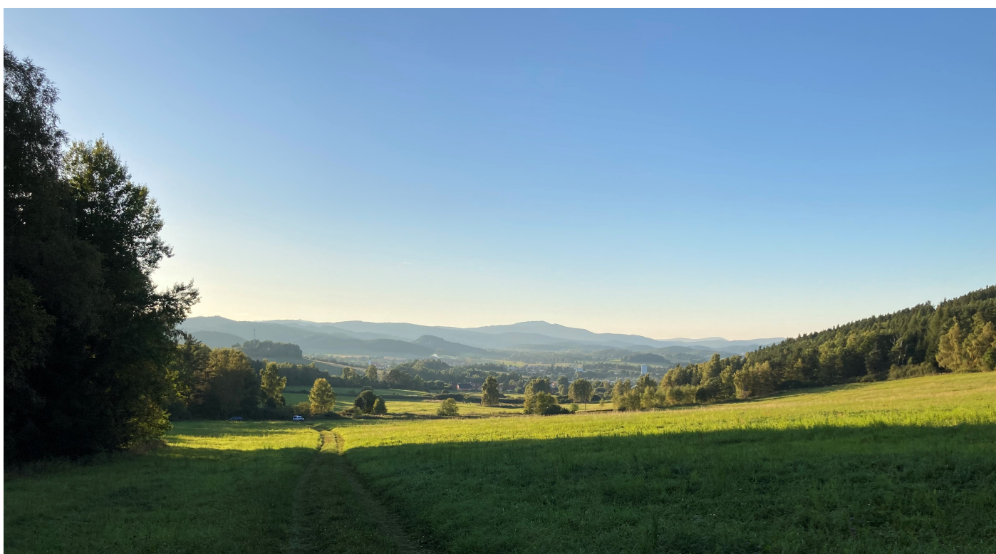
Panoramatický pohled na Kájov z Kladrného („Na Úvrati“)

Ochrana přírodních hodnot je zajištěna zejména respektováním plánu územního systému ekologické stability (ÚSES) v rámci územního plánu obce. ÚSES je vymezen jako území se zvláštní ochranou. Tvoří ho vzájemně propojený soubor přirozených i pozměněných, avšak přírodě blízkých ekosystémů, které udržují přírodní rovnováhu. Hlavním smyslem ÚSES je posílit ekologickou stabilitu krajiny (viz zákon č. 114/1992 Sb.). ÚSES obce Kájov obsahuje celkem 56 ekologicky významných krajinných prvků lokálního až nadregionálního významu, které zabezpečují ekologickou rovnováhu území. Územní plán v maximální možné míře respektuje lesní plochy. Na druhou stranu z důvodu velké poptávky po bydlení dochází k výraznému záboru zemědělské půdy, často té nejvyšší kvality. V územním plánu je navrženo 63 ha záboru ze zemědělského půdního fondu. Největší zastoupení ve vyžádaném záboru mají plochy s funkcí bydlení. Roste podíl umělých povrchů, který může nepříznivě ovlivňovat např. odtokové poměry v území.